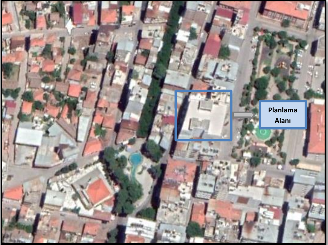
Şekil 1.1-Planlama Alanının Uydu Görüntüsü

İmar planına konu alan Aydın İli, İncirliova İlçesi 9170 parsel içindedir. Alan İncirliova kent merkezinde bulunmaktadır.