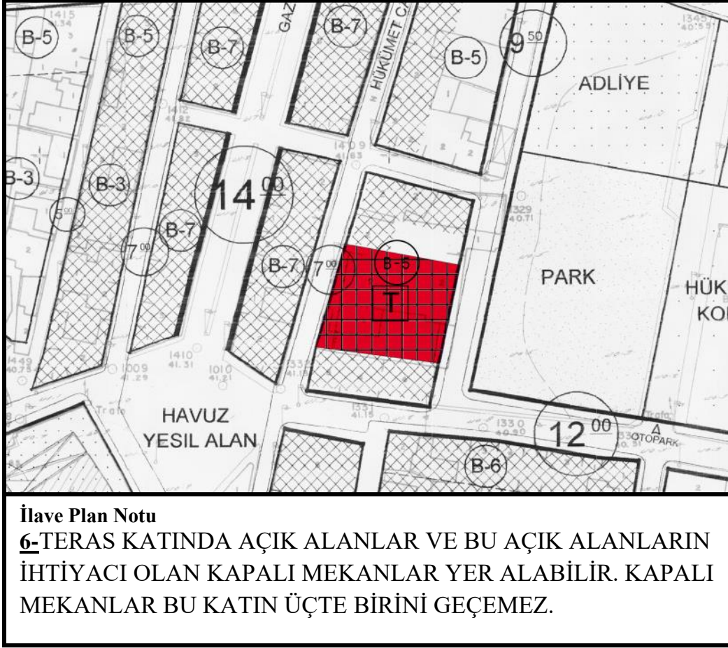
Şekil 4.1 Öneri İlave Plan Notu

Mevcut plana uygulama kolaylığı sağlaması amacıyla 6 numaralı plan notu ilave plan notu değişikliği olarak eklenmiştir.